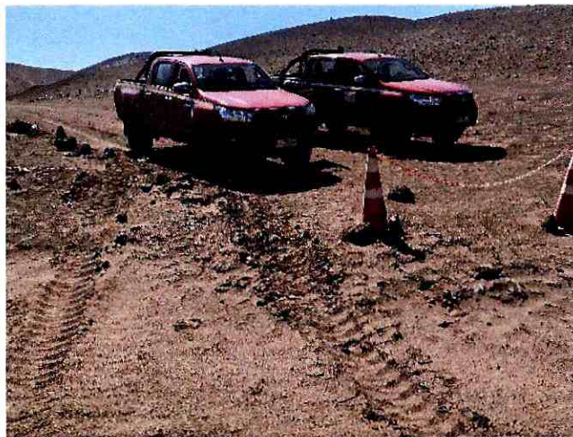
Sector torre 44 (B4)