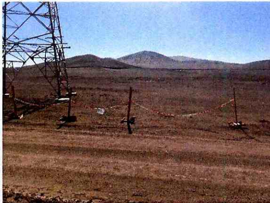
B3 Barrera 3: Cierre con cadena Torre 44