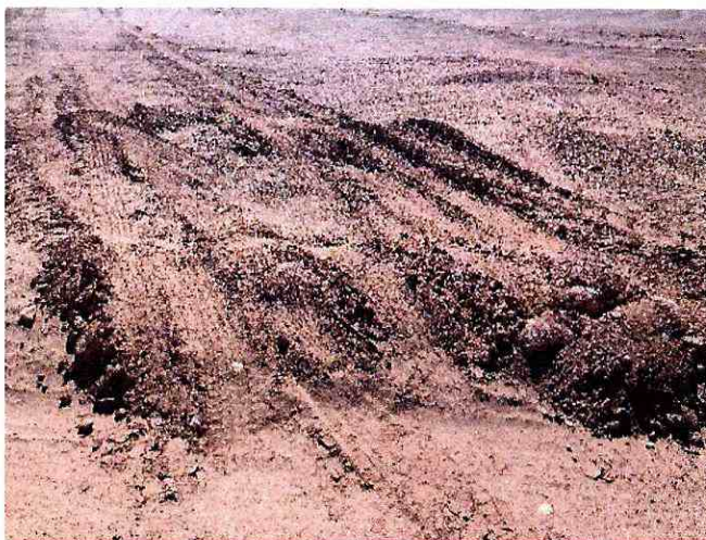
Parte de Pretil afectado en torre 44 (B5)

Respecto a superficie de afectación, dado que el rodillo cruzo las huellas en sentido aproximadamente transversal (a excepción de LAT GS 10 y LAT GS 15 cruzados en diagonal), la superficie afectada es el ancho del rodillo (2,2 m) por el ancho del rasgo vial afectado. El siguiente cuadro da cuenta de la superficie y profundidad de los rasgos viales afectados por el rodillo compactador.