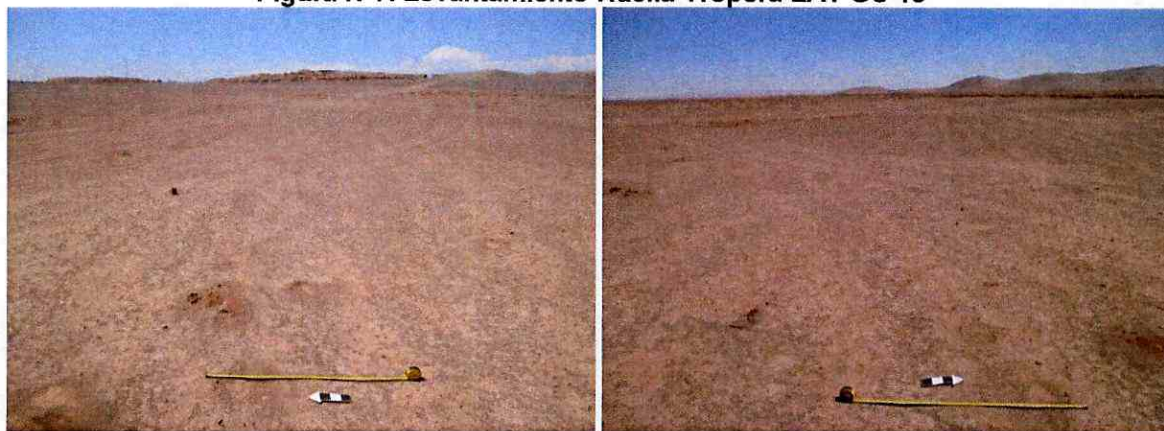
Figura N°7. Levantamiento Huella Tropera LAT GS 15

Se identifican materiales referidos a Metal, Vidrio y Textil, destacando cuerpos de botellas fragmentadas, sacos semienterrados, alambres, láminas de metal y latas de conserva. Estos materiales se encuentran asociados cronológicamente a las salitreras. Estos materiales deben estar directamente relacionados al transporte de bienes y mercancías. Cada una de estas huellas pudo originarse debido al alto tránsito de carretas y animales desde y hacia la salitrera.