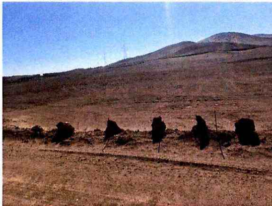
B1 Barrera 1: Cierre con elementos