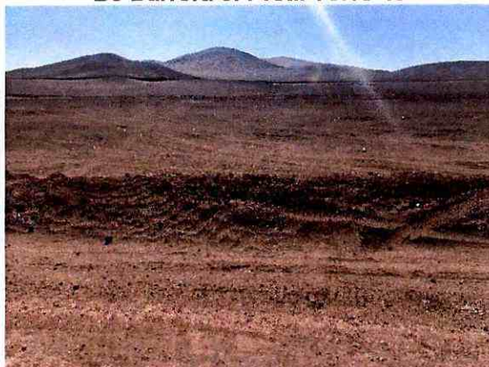
Figura N°3. Fotografía barrera B5 B5 Barrera 5: Pretil Torre 45